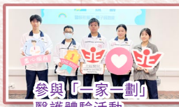
參與「一家一劃」醫護體驗活動