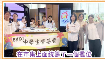
在市場上面統籌了一個攤位