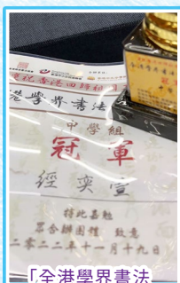
「全港學界書法公開賽」中學組冠軍獎盃及獎狀