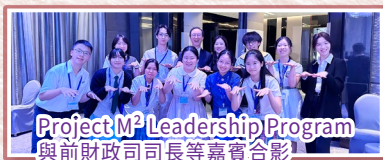
Project M 2 Leadership Program 與前財政司司長等嘉賓合影

這些成就的背後，最感謝無條件支持我的父母與老師。他們的信任讓我見識更廣闊的世界，理解人生道理。我希望將來能永存初心，協助有需要的人，為社會作出貢獻。願以開放的心態看世界，走出屬於自己的一條路。