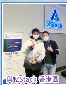
與ZStack香港區行政總裁合照

我期望未來能考入理想大學，提升家庭生活，貢獻社會，協助有需要的人，為建設更美好的明天而努力。