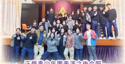
正覺青少年團表演之後合照

衷心感謝學校提供豐富機會，從交流團、尖子計畫到各類比賽，都助我不斷進步。未來我將堅定前行，努力學業，考上理想大學，持續提升自我、回饋社會，以行動幫助更多需要幫助的人。