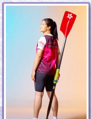
獲頒學生運動員獎