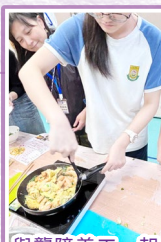
與聾障義工一起做的蝦仁炒蛋