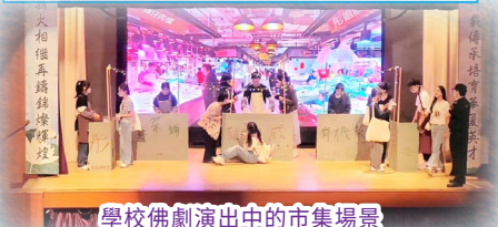
學校佛劇演出中的市場場景