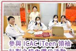
參與IGAC iTeen領袖計劃之校內攤位活動