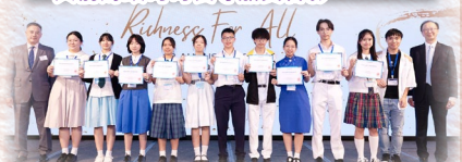
榮獲 Project M 2 Leadership Program 全場總冠軍