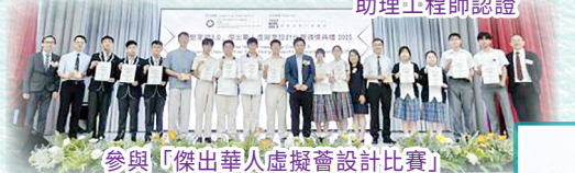
參與「傑出華人虛擬薈設計比賽」