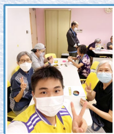
於屯門醫院義工服務中與長者一同製作串珠手鏈