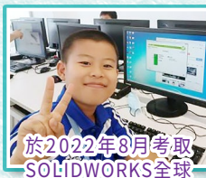
於2022年8月考取SOLIDWORKS全球助理工程師認證