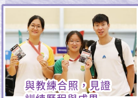
與教練合照，見證訓練歷程與成果

感謝學校和老師給予我多元發展的機會，讓我發掘潛能、磨練意志。未來我將帶著賽艇培養出的堅持與信念，勇敢面對每一個挑戰，相信只要盡力，就能成為最好的自己。