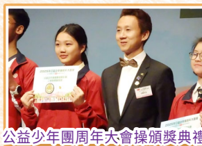
公益少年團周年大會操頒獎典禮