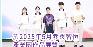
於2025年5月參與智恒產業園作品展覽