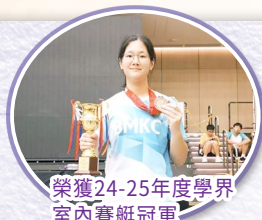
榮獲24-25年度學界室內賽艇冠軍