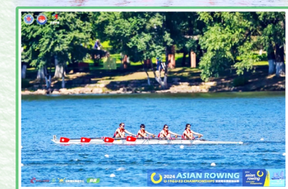
2024亞洲賽艇U19&U23錦標賽比賽時的照片