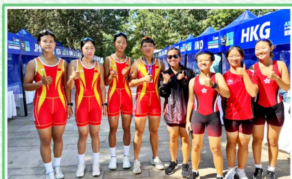
2024亞洲賽艇U19&U23錦標賽和中國隊的合照