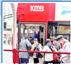
於「冬日送暖」義工服務中協助視障人士安全上車