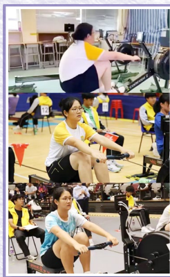
三年學界室內賽艇參賽剪影