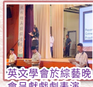
英文學會於綜藝晚會呈獻戲劇表演