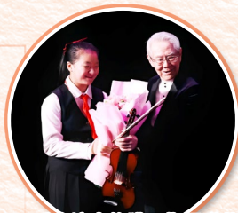
四重奏演出後獲王指揮贈花