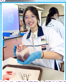
於生物課進行豬心解剖實驗