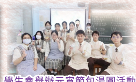
學生會舉辦元宵節包湯圓活動

“Do not go where the path may lead, go instead where there is no path and leave a trail.”