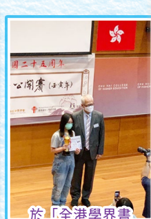
於「全港學界書法公開賽」頒獎典禮中接受表彰