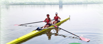
2025年全國賽艇青年錦標賽比賽前的照片