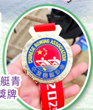
2025年全國賽艇青年錦標賽冠軍獎牌