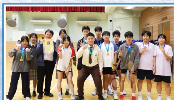
學生會「Show off your voice」活動合照