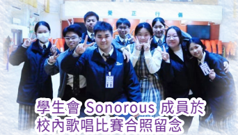
學生會 Sonorous 成員於校內歌唱比賽合照留念