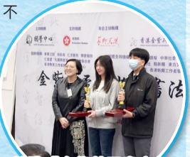
榮獲「金紫荊盃青少年書法大賽2024」一等獎

我願做一名「以墨鑄魂」的行者，將挫折碾作墨，堅韌凝為鋒，一筆一劃書寫不屈的人生篇章，並以此感染更多人，共同堅守心中的熱愛。