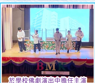
於學校佛劇演出中擔任主演