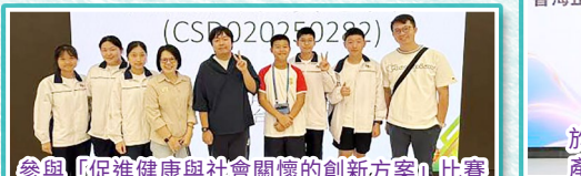
參與「促進健康與社會關懷的創新方案」比賽