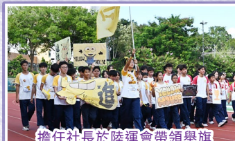
擔任社長於陸運會帶領學旗