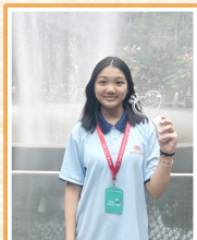
公益少年團傑出團員新加坡交流團