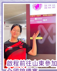
啟程前往山東參加全國錦標賽