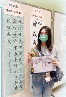
榮獲「全港學界書法公開賽」中學組冠軍