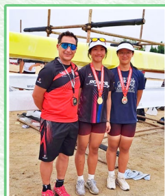
2025年全國賽艇青年錦標賽和教練以及隊友的合照