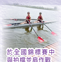
於全國錦標賽中與搭檔肩作戰