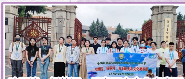
哈爾濱綏芬河長春歷史文化考察團