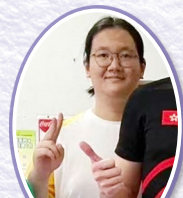
中三時初加入賽艇隊之紀錄照