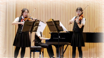
於微風城市音樂廳參與三重奏演出