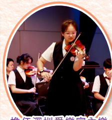
擔任深圳愛樂室內樂團首席，演奏《A小調協奏曲第三樂章》