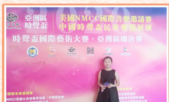
晉級NMCC亞洲區總決賽，榮獲金獎