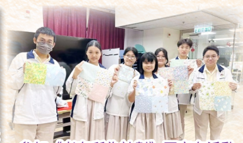
參加《老有所為計劃》百家布活動