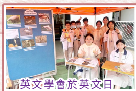
英文學會於英文日，設置攤位活動